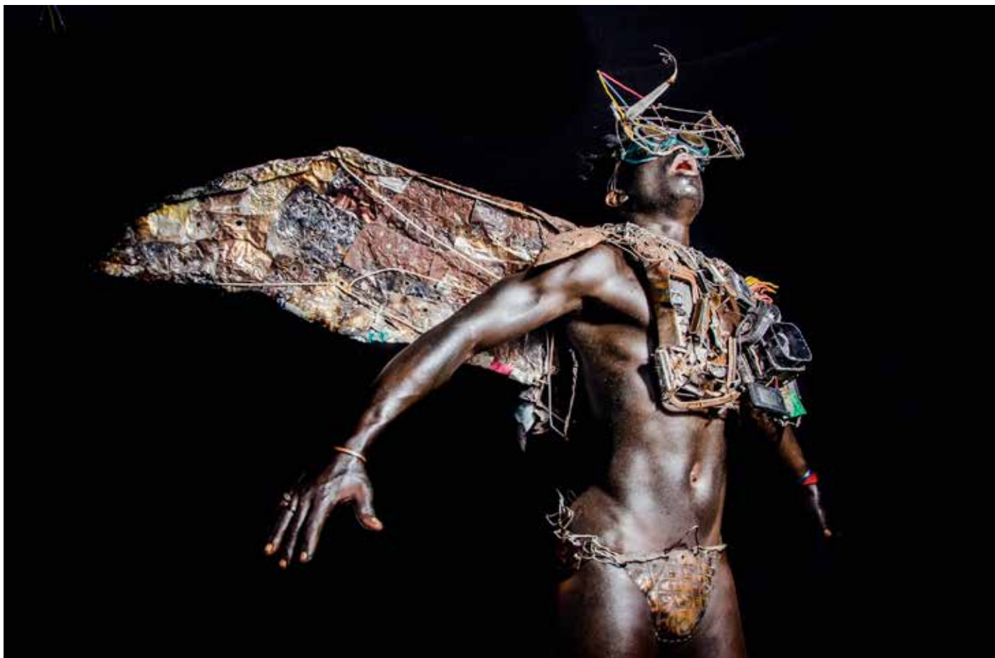
Série Mabele Ya Mboka Kongo 60 x 40 cm 2024

Papier photo classique brillant RC 220g pour Pigmentaire Face avant, plexi 3mm anti-reflet face arrière, dibond 2 mm Châssis rentrant aluminium 44 x 20 mm